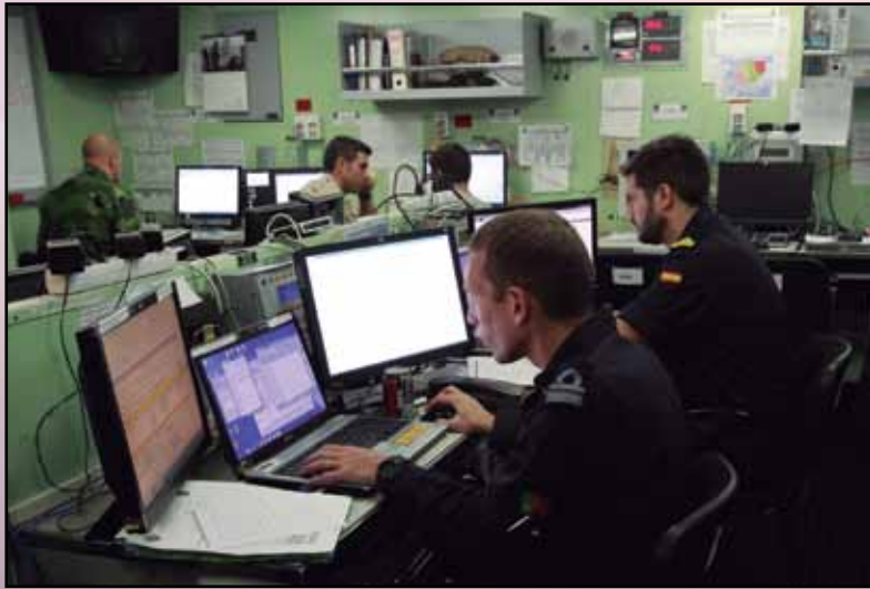
El Estado Mayor embarcado dirige las maniobras de los medios navales y de las fuerzas de desembarco en el ejercicio Noble Mariner .